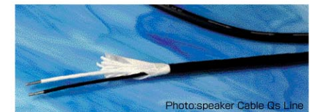
Photo:speaker Cable Qs Line